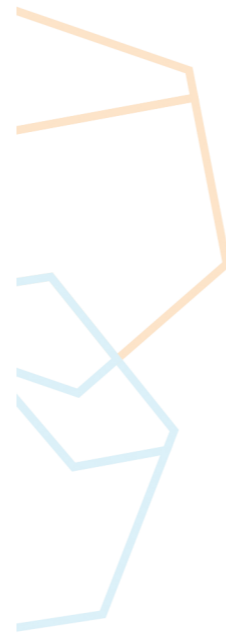
Plan individuel de transition : après l'école... PIT